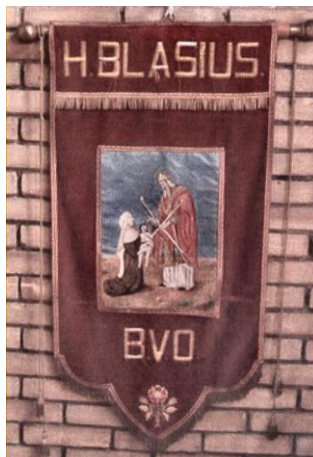
Processievaandel Heilige Blasius