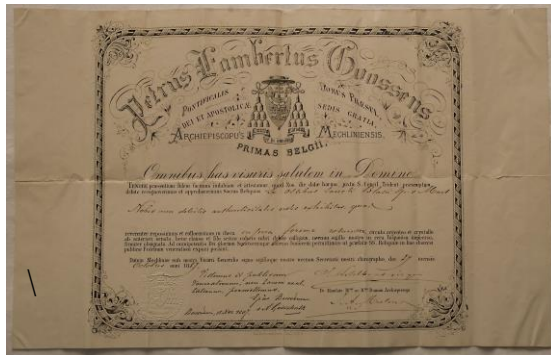
Certificaat van Echtheid H. Blasius relikwie 27 oktober 1887