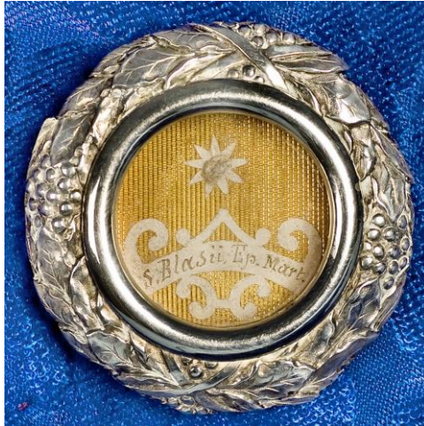
Relikwie van de Heilige Blasius