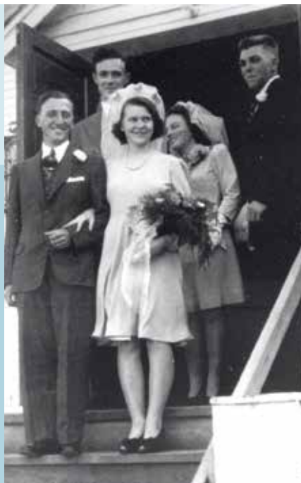
5 De huwelijksfoto op 21 september 1946