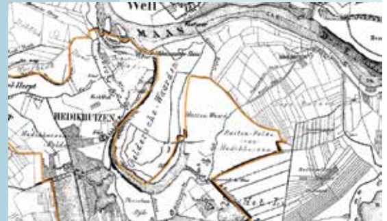
2 De "Beerse overlaat"