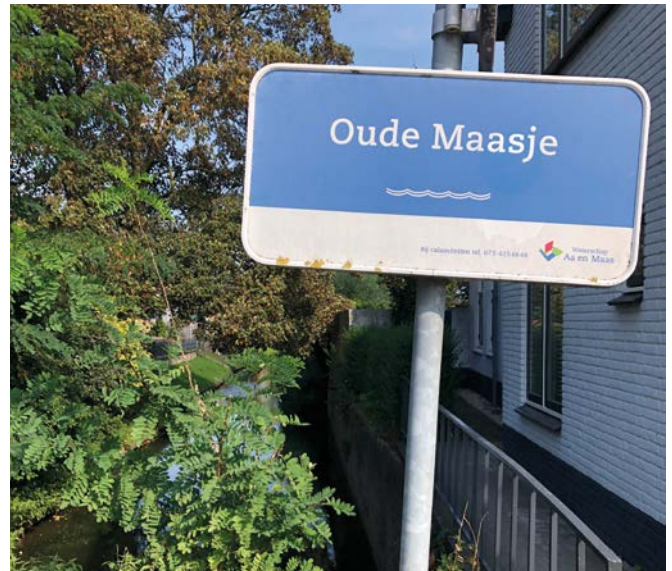
Het Oude Maasje.

Toen mijn fascinatie voor de Maas enige bestuursleden van Angrisa ter ore kwam, werd me gevraagd om iets voor de Nieuwsbrief te schrijven. Het moest echter wel een verband hebben met Engelen. Dat was een uitdaging, want Engelen ligt eigenlijk niet aan de Maas.