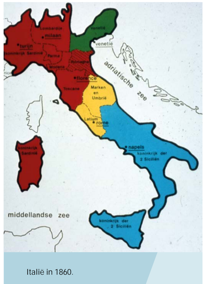
Italië in 1860.

Deze zoeaven kregen een schilderachtig uniform dat bestond uit een wijde broek, een kort jasje en een vest, grijsblauw van kleur, afgezet met rode tressen en chevrons (mouwstrepes). Op het hoofd droeg men een kepi, de voeten staken in stevige bergschoenen. De onder-