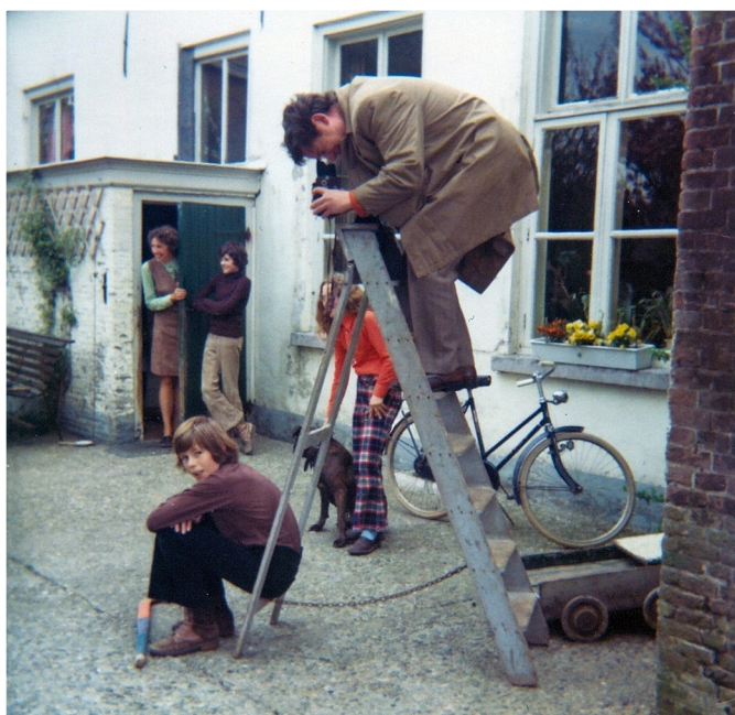
① De fotograaf gekiekt door Henk Vermeijden.