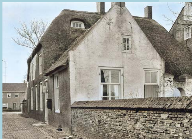
De Kerksteeg of Kerkstraat met postkantoor in 1965 en het nieuwe pand Achterstraat 10.