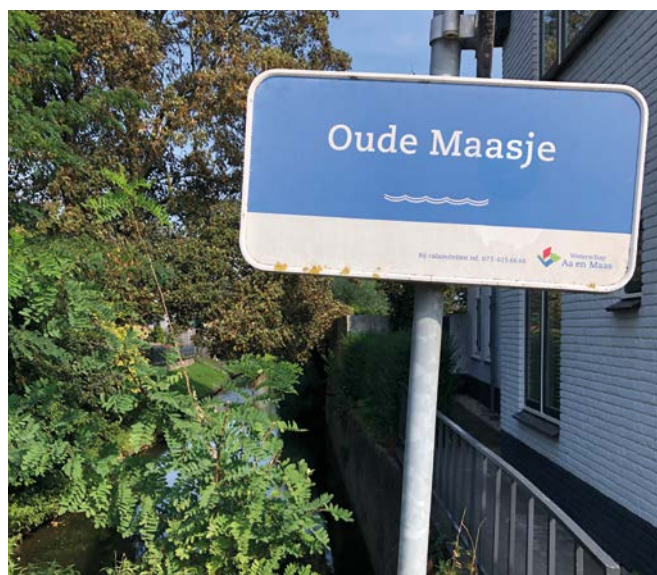
③ Het Oude Maasje.

Toen mijn fascinatie voor de Maas enige bestuursleden van Angrisa ter ore kwam, werd me gevraagd om iets voor de Nieuwsbrief te schrijven. Het moest echter wel een verband hebben met Engelen. Dat was een uitdaging, want Engelen ligt eigenlijk niet aan de Maas.