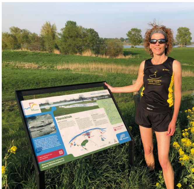
Infobord over het Damblok in Hedikhuizen, waar je niet zo maar langs loopt!