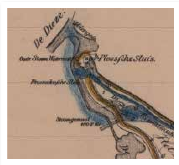
Fragment van de kadastrale kaart van de Polder van der Eigen (1880)

>> Ook de molen van Engelen is verdwenen. Of eigenlijk de molen aan de overkant, de Dieskant. Deze stond bij het Molengat. In 1742 werd hij voor 3000 gulden verkocht (Statistiek Tableau der Polders in Noord-Brabant, 1843) door de polder het Laag Hemaal aan de polder Van der Eigen.