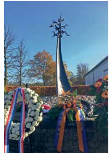
Monument van Verdraagzaamheid te Haelen