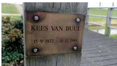
Verbindingsbruggetje Fientje Brouwersstraat/Zuster Hilkerstraat