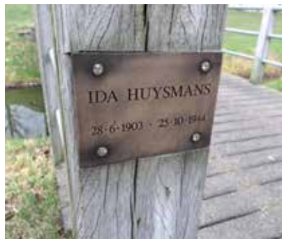
Verbindingsbruggetje bij 't Hoogh/Zuster Bosstraat