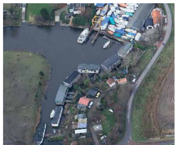
Het Molengat in 2014