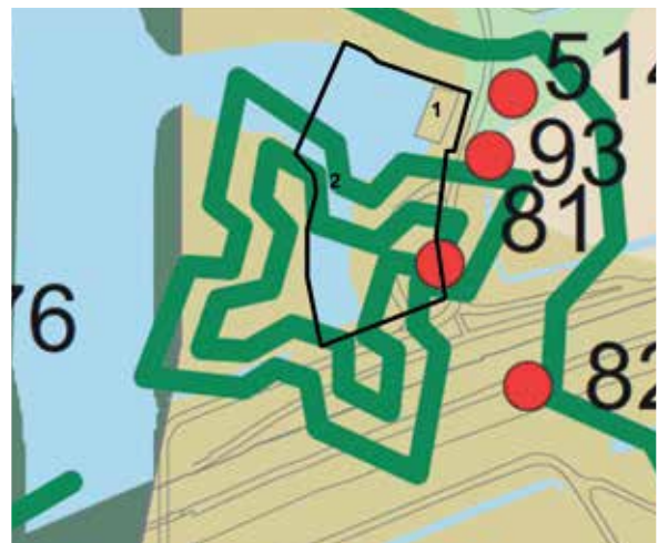
81 = molen