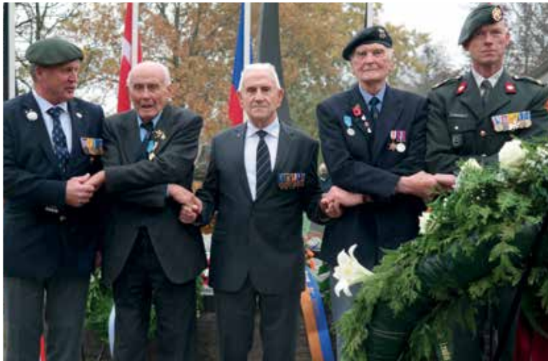
Veteranen tijdens de herdenking te Haelen