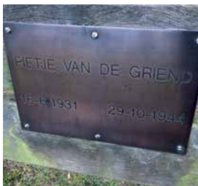
Herdenkingsbankje op het 29 Oktoberplein