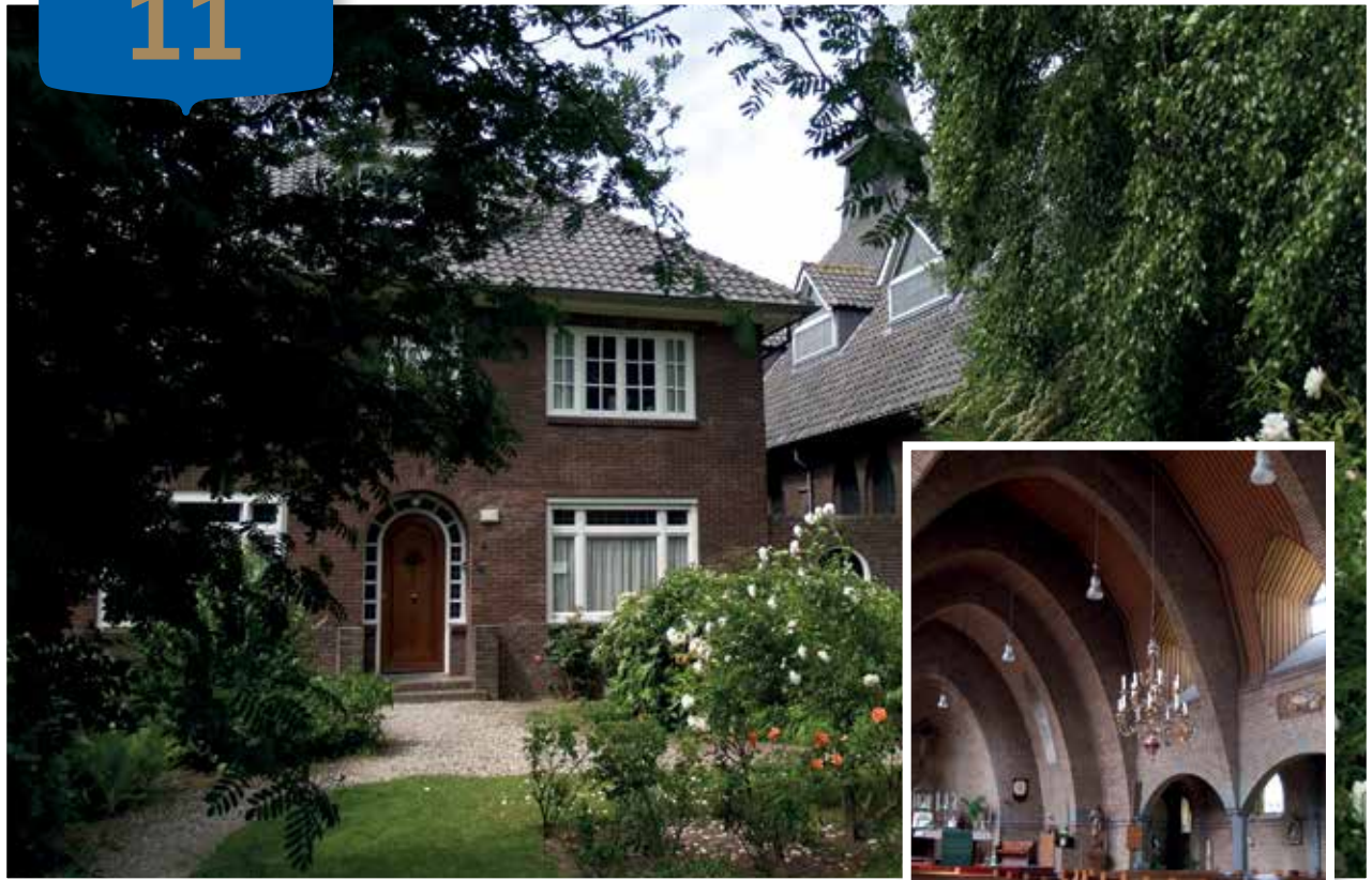
De pastorie en de St. Lambertuskerk